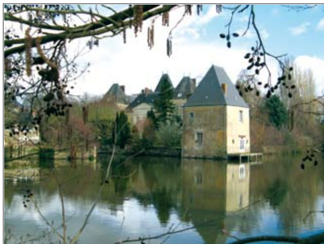
Το Κέντρο Διαλογισμού Καντάμ-πα στη Γαλλία

Γενικά, για να γίνει κάποιος ένας πραγματικός Γκέσε, δεν είναι απαραίτητη η αναγνώριση από τον Δαλάι Λάμα. Πριν από τον Πρώτο Δαλάι Λάμα υπήρχαν πολλοί αγνοί και πραγματικοί Γκέσε, όπως ο Γκέσε Ποτάουα, ο Γκέσε Τζαλγιούλγουα, ο Γκέσε Λάνγκρι Τάνγκπα, ο Γκέσε Σαράουα και ο Γκέσε Τσεκάουα. Αυτοί οι Καντάμ-πα Γκέσε δεν είχαν καμία σχέση με κάποιον Δαλάι Λάμα. Ο Γκέσε Κέλσανγκ δεν έχει σχέση με το Δαλάι Λάμα αλλά όμως συνεχίζει να είναι ένας αγνός και πραγματικός Γκέσε.