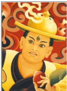
Ο Προστάτης του Ντάρμα Ντόρτζε Σούγκντεν, μια εκδήλωση του Βούδα της Σοφίας