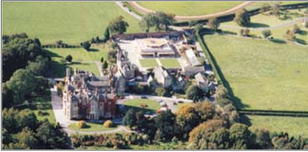
Το Κέντρο Διαλογισμού Καντάμ-πα Μαντζούσρι στην Αγγλία

μελέτης, «Δεν θα πρέπει να διαβάσετε άλλα βιβλία από αυτά του Γκέσε Κέλσανγκ». Το κίνητρο αυτού του Δασκάλου ήταν να βοηθήσει τους μαθητές του να περάσουν τις εξετάσεις τους σε ένα από τα προγράμματα στο οποίο συμμετείχαν εμποδίζοντας τους περισπασμούς και τη σύγχυση που εμφανίζεται όταν διαβάζουν άλλα βιβλία. Αλλά αυτός όμως δεν είναι ένας κανόνας της ΠΝΚ. Όσοι ανήκουν σε αυτήν την παράδοση φυσικά έχουν δικαίωμα επιλογής ως προς το ποια βιβλία θα διαβάζουν. Η συμβουλή αυτού του Δασκάλου δεν ήταν αποτέλεσμα μιας αιρετικής συμπεριφοράς, προσπαθούσε μόνο να βοηθήσει τους μαθητές του να περάσουν τις εξετάσεις τους.