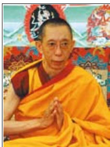
Ο Σεβάσμιος Γκέσε Κέλσανγκ Γκιάτσο