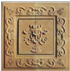
Ελάτε κάτω από την ομπρέλα του Βουδισμού

Κάποιοι διαδίδουν πως ο Πέμπτος Δαλάι Λάμα και ένας Γκελούγκπα Λάμα ο Νάουανγκ Τσόγκντεν, απέρριψαν την άσκηση του Σούγκντεν, αλλά αυτό είναι λάθος. Δεν υπάρχει απόδειξη για κάτι τέτοιο, και δεν υπάρχει κανένας έγκυρος λόγος για να πούμε ότι οι ασκούμενοι στο Ντόρτζε Σούγκντεν είναι καλτ.