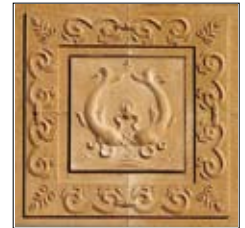
Πάντα να είσαστε γαλήνιοι και σε αρμονία με τους άλλους

Σε αυτήν την παράδοση, η Βινάγια – οι διδασκαλίες του Βούδα σχετικά με τον έλεγχο του πνεύματος – είναι το Λαμρίμ, τα Στάδια του Μονοπατιού προς τη